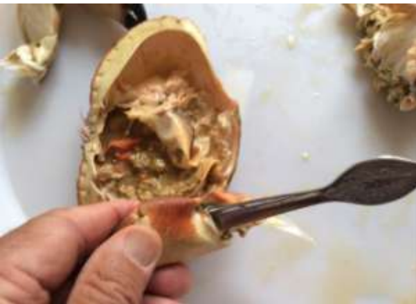
Stikk skjeen inn i leddet som vist her. Hold om både skje og leddet og press utover.