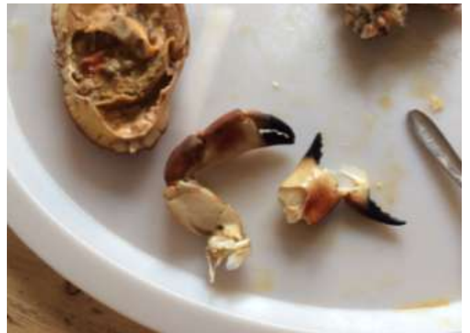
Riv gjerne av kloens øvre del.