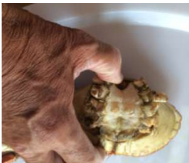
Løfte ut fotstødet