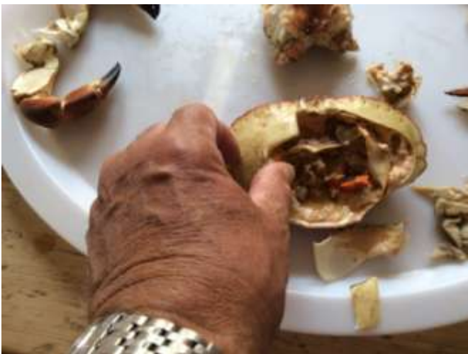
Det går en søm på undersiden! Lett å brette opp skallet til sømmen for å oppnå større åpning!