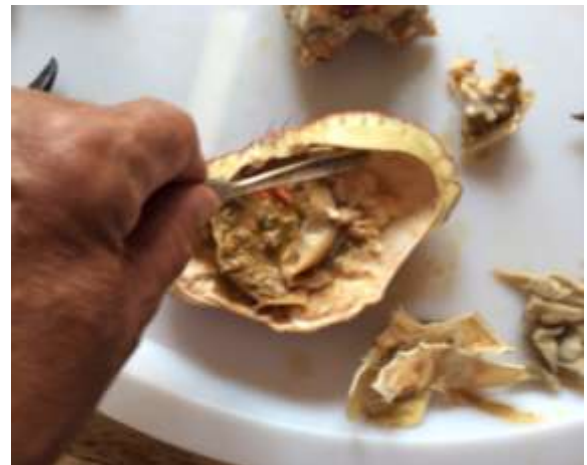
Skrap med skjeen.