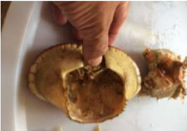
Trykk ned for å løsne Paven!