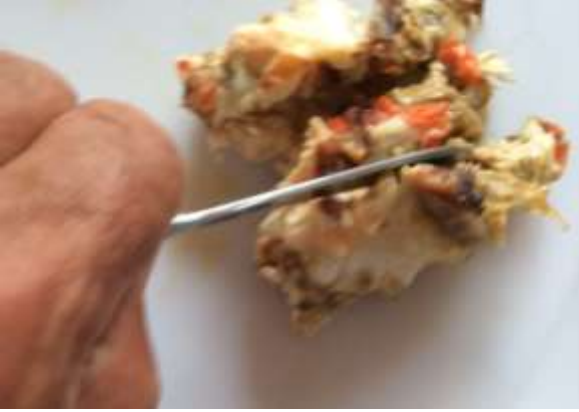
Mye godt i fotstød