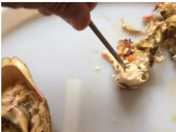
Plukk ut godsaker av fotstøt.