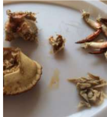
Slik ser Paven ut - den lille midt på bildet