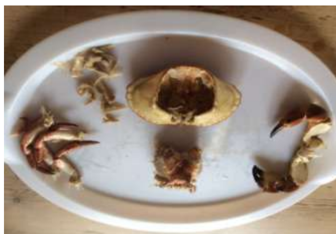
Små klør (føtter ) og gjeller - til høyre er bare å kaste (( ev. Suge på klørne)