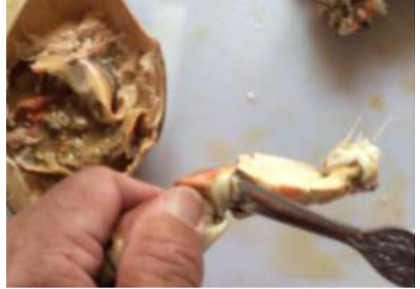
Ytterste ledd kan bare brekkes av! Ev. Med krabbeskjeen.